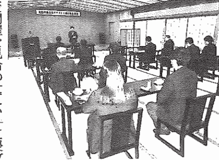
4年ぶりの温泉総会

で開催を見合わせてい た温泉地での総会を4 年ぶりに開いた。会員 28社中26社(委任状含 む)が出 し本年度 予算など 了承した 総会の 頭で竹中 行会長(中 製作所 長)があ さつ。昨 はロシア ウクライ に侵攻したり銅が過 最高値を更新するた 激動の年だった。一 で新型コロナの影響