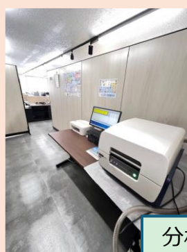
分析室は以前より広くなり、作業効率が向上。ゆとりあるスペースで、より精度の高い分析業務に取り組めるようになりました。