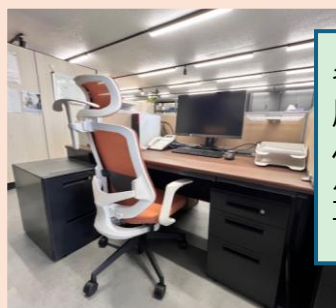
各デスクにはパーテーションを設置し、周囲を気にせず集中できるワークスペースを確保。リラックスしながらも生産性の高い環境を実現しています。