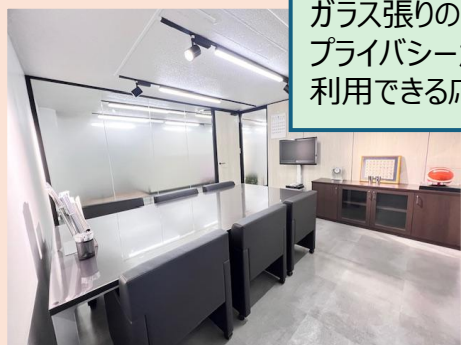
ガラス張りの開放感を保ちながらも、プライバシーが確保された安心して利用できる応接室です。