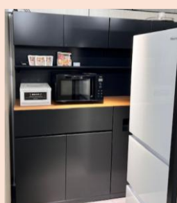
キッチンには健康経営の一環で取入れた企業向けの設置型社食サービスがあり、オフィスにしながら新鮮な野菜やフルーツ、サラダ、惣菜などを手軽に楽しむことができます。