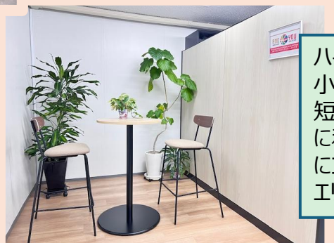
ハイテーブルとハイチェアを設置した小規模なミーティングスペースです。短時間の打ち合わせや軽い相談に利用でき、応接室を使わず気軽にコミュニケーションが取れる便利なエリアとなっています。