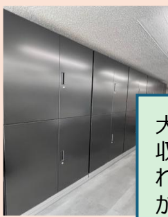
大容量の収納ラックを新設し、収納スペースが大幅に拡充されました。書類や備品の整理がしやすくなり、オフィス全体の動線もスムーズになっています。