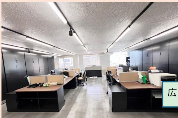
広々としたワークスペース